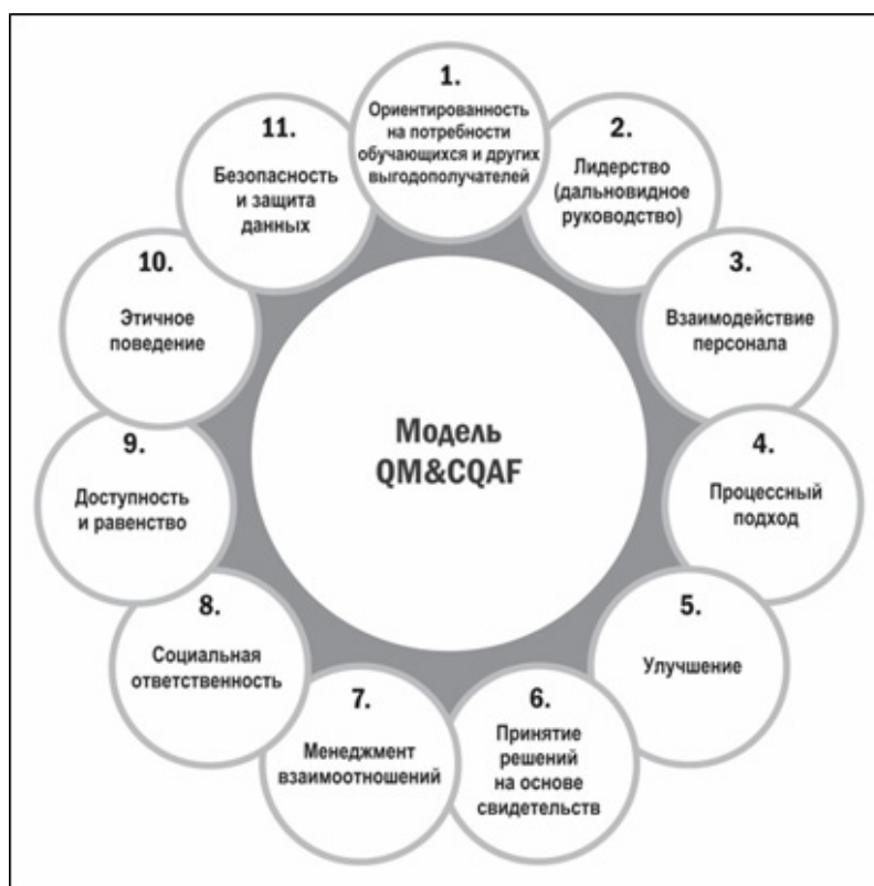
Рисунок 3 – Принципы менеджмента качества QM&CQAF

PDCA (рисунок 1), принципы менеджмента качества, сформулированные в стандартах ISO 9000:2015 и ISO 21001 (рисунок 3), а также методика оценки процессов на основе ключевых показателей рамки CQAF [6].