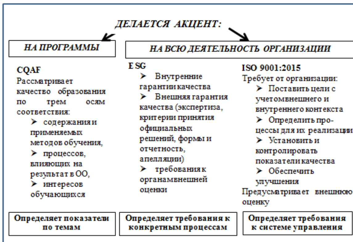
Рисунок 2 – Сравнение стандартов качества образования

Преимущества и недостатки наиболее известных и пригодных для системы высшего и дополнительного профессионального образования и профессионального обучения моделей представлены в таблице 1.