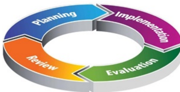
Рисунок 4 – Цикл обеспечения качества EQAVET:

Планирование – Осуществление – Оценка – Анализ и улучшение