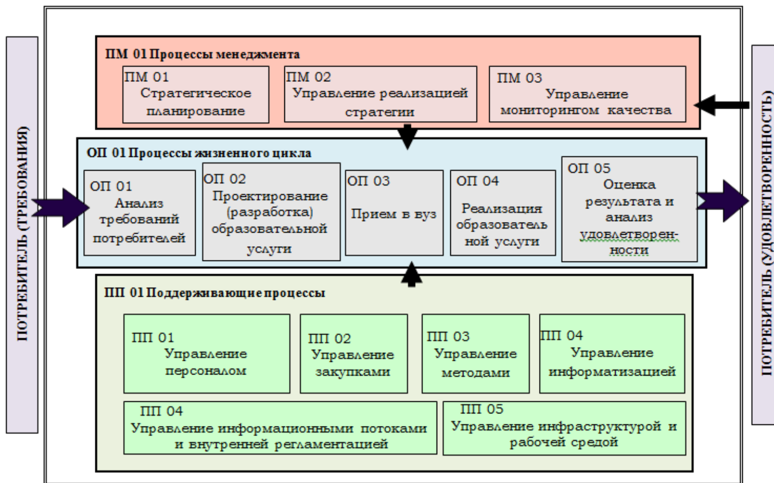
Рисунок 5 – Карта (ландшафт) процессов образовательной организации