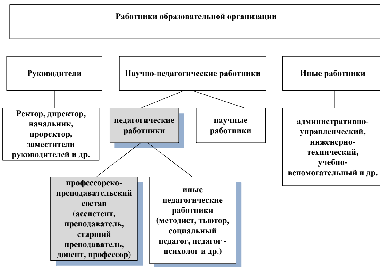
Рисунок 4 – Состав работников образовательной организации

В профессиональном стандарте учтены возросшие высокие требования к образованию преподавателя. Требования к образованию педагогического работника в профессиональном стандарте согласуются с требованиями к образованию, изложенными в других, ранее принятых нормативных правовых документах, а именно в положении о лицензировании образовательной деятельности и в федеральных государственных образовательных стандартах.