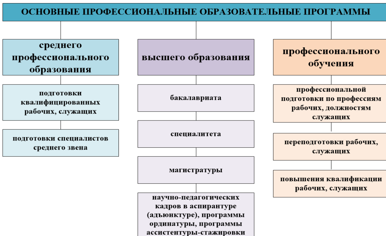
Рисунок 2 - Виды основных профессиональных образовательных программ

На рисунках 2 и 3 представлены виды основных и дополнительных профессиональных программ.